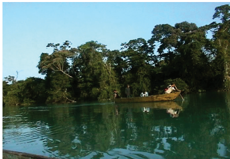
Fotograma tomado del video "Teklum Maya"

Formato Mini-DV. Duración 52 min. Español con subtítulos en inglés. SCLC, Chiapas: INI; Teklum Maya, S.C., Red de Turismo Alternativo de Pueblos Indígenas de Chiapas y PVIFS.