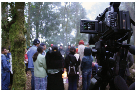
Cámara Ritual.