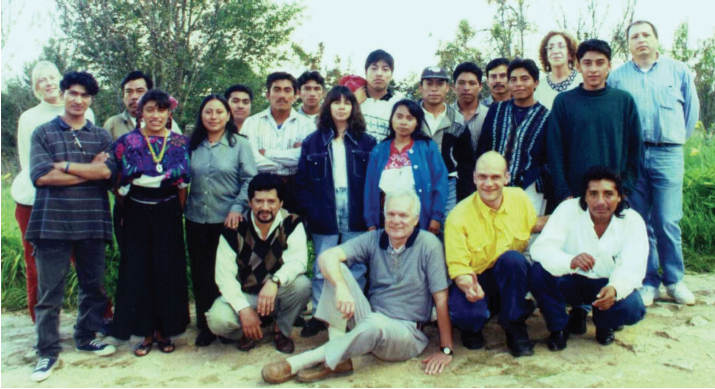
Estudiantes y profesores del Diplomado en Antropología Visual (DAV).

Taller de video-grabación realizado del 15 al 20 de octubre del 2001, para jóvenes lacandones en la comunidad de Nahá, selva Lacandona, Chiapas, en colaboración con la Asociación Cultural Na Bolom, A.C.