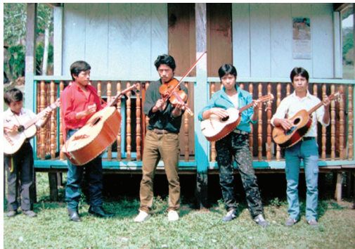
Músicos en la fiesta patronal, Ejido El Guanal, 1992.

Las primeras imágenes de este video fueron tomadas en 1991 a petición de los pobladores del ejido Guanal (selva Lacandona) quienes nos invitaron a visitar su tierra y a compartir la fiesta a su santo patrono, San Caralampio. Lo mismo sucedió en 1992 y 1993. Más tarde, en 1994, cuando se dio el levantamiento armado zapatista, la citada comunidad se dividió y una parte de sus pobladores se fueron a vivir en una colonia marginada de la ciudad de Ocosingo. Este video nos habla de la nostalgia que sienten los guanaleros, ahora urbanos, por la tierra selvática "prometida". El video integra también imágenes de la fiesta del santo patrono San Caralampio tomadas ya en la ciudad de Ocosingo en 2002 ahora sí por los propios jóvenes indígenas. El video da cuenta del dolor y la desesperanza que produjo –produce– la ruptura. Nos lleva de la selva siempre verde a la selva de asfalto y nos muestra cómo, en el contexto urbano, la nostalgia contribuyó a rescatar y reinventar la "tradición de San Caralampio" a pesar del conflicto político-militar no resuelto.