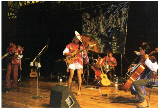
Grupo Sak Tzevul en concierto en el Museo El Chopo, ciudad de México.