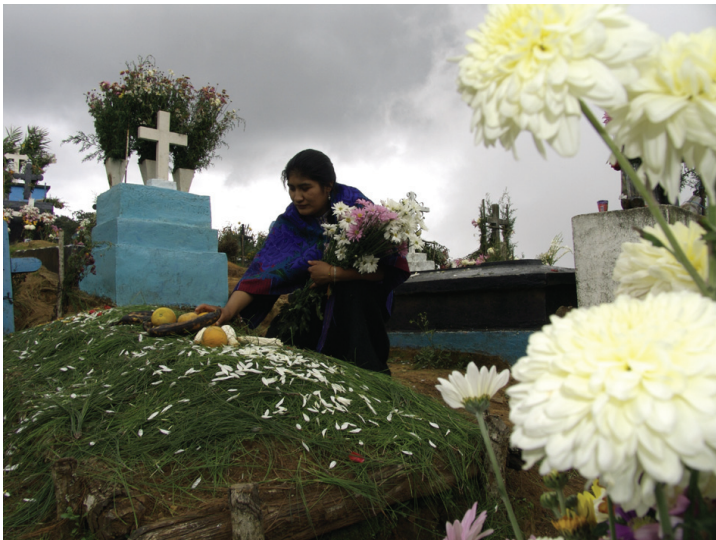
Video " Día de muertos en la tierra de los murciélagos ".