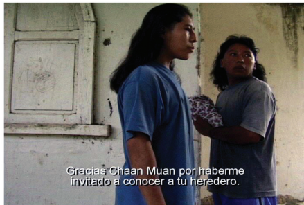
Fotograma tomado del video "Más de mil años después..."

Formato Mini-DV. Duración 19 min. Maya Lacandón con subtítulos en español e inglés. SCLC y Comunidad Lacanjá Chansayab, Chiapas: PVIFS y Grupo Rescate y Difusión de la Cultura Lacandona.